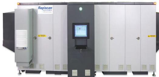
Модель с кондиционером воздуха (опция).

Утверждена к использованию Министерством транспорта