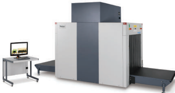
Размер досмотрового туннеля (ШИРИНА И ВЫСОТА): 1000 x 1000 мм

УСТАНОВКА RAPISCAN 628XR С БОЛЬШИМ ДОСМОТРОВЫМ ТУННЕЛЕМ И НИЗКИМ РАСПОЛОЖЕНИЕМ ЛЕНТЫ КОНВЕЙЕРА УПРОЩАЕТ ЗАГРУЗКУ И ВЫГРУЗКУ ОБЪЕКТОВ СКАНИРОВАНИЯ ИЗ СИСТЕМЫ.