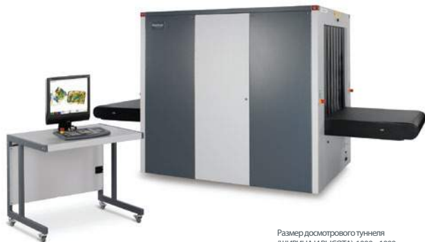
Размер досмотрового туннеля (ШИРИНА И ВЫСОТА): 1000 x 1000 мм

УСТАНОВКА RAPISCAN 627XR ПРЕДНАЗНАЧЕНА ДЛЯ ДОСМОТРА КРУПНЫХ ПОСЫЛОК, БАГАЖА И НЕГАБАРИТНЫХ ГРУЗОВ В ПУНКТАХ ТАМОЖЕННОГО КОНТРОЛЯ В АЭРОПОРТАХ И НА ИНЫХ ОБЪЕКТАХ С ПОВЫШЕННЫМИ ТРЕБОВАНИЯМИ К ОБЕСПЕЧЕНИЮ БЕЗОПАСНОСТИ.